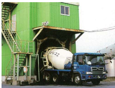
荷姿：生コン車 (1.0 ~ 4.5m³/車)