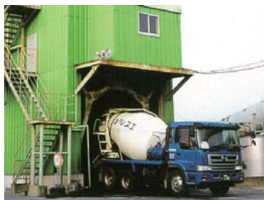
荷姿：生コン車 (1.0 ~ 4.5m³/車)

高炉セメントは、地球温暖化ガスの発生量が少ないことから、グリーン購入品目の特定調達品目に指定されています。