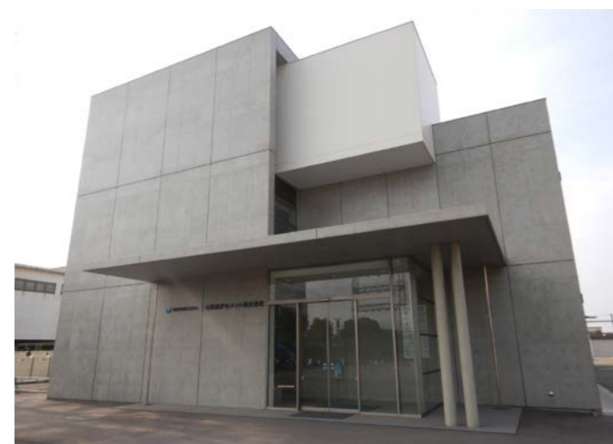
外観はRC造らしい打ち放しの仕上げとし、素材の力強さを感じさせるデザインに(写真左)。室内でポイントとなったのは、2階の執務室だ。約18mものスパンで構成される大空間では、上階の床を支えている梁をそのまま打ち放しで表すことによって、室内側にもコンクリートらしい質感が伝わってくる(写真下)

工事名/日鉄高炉セメント本社建て替え工事 建築主/日鉄高炉セメント 設計・施工/竹中工務店 建築地/北九州市小倉北区 用途地域/工業専用地域 敷地面積/16万5570m 2 建築面積/747.48m 2 延べ床面積/1966.34m 2 主要用途/事務所 構造/RC造 規模/地上3階 施工期間/2019年9月~20年7月